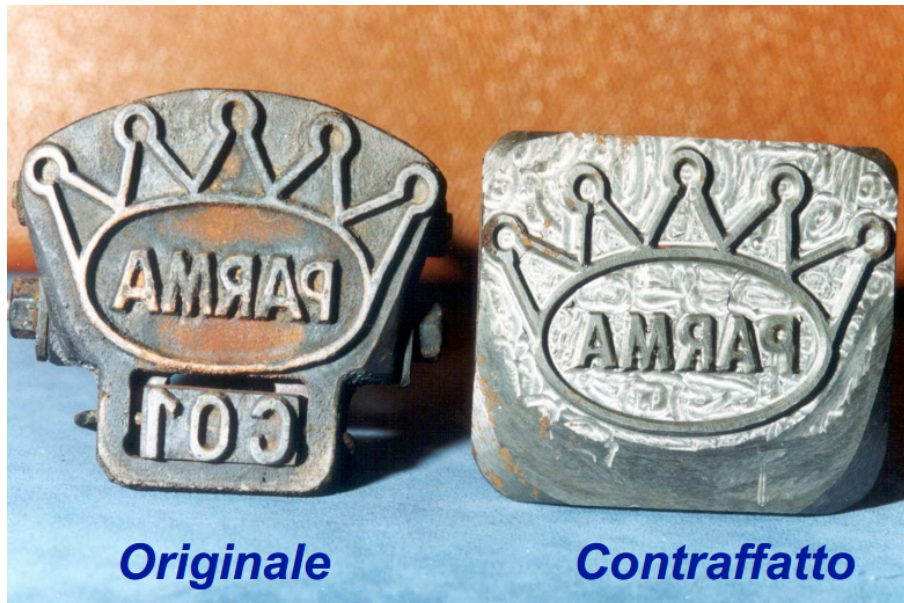
Fig. 1 Esempio di marchio originale e contraffatto del prosciutto di Parma

In Italia i casi più frequenti di frodi alimentari a danno del consumatore si realizzano attraverso false dichiarazioni in merito alla provenienza, alla qualità, alla composizione e alle caratteristiche di un prodotto alimentare. Nel primo semestre del 2000, su 4802 aziende alimentari e ristoranti controllati dall'Ispettorato Centrale Repressione frodi del Ministero Politiche Agricole e Forestali (MIPAF), in circa il 12% sono state rilevate anomalie. Le frodi sono in netto aumento (+ 32% nell'anno 2008-2009). Molto colpiti sono i settori dei prodotti tipici e dei prodotti biologici. Per quanto riguarda le importazioni, nel 2007 Cina e Turchia sono risultati i paesi da cui maggiormente provengono prodotti irregolari (Colavita et al. 2012).